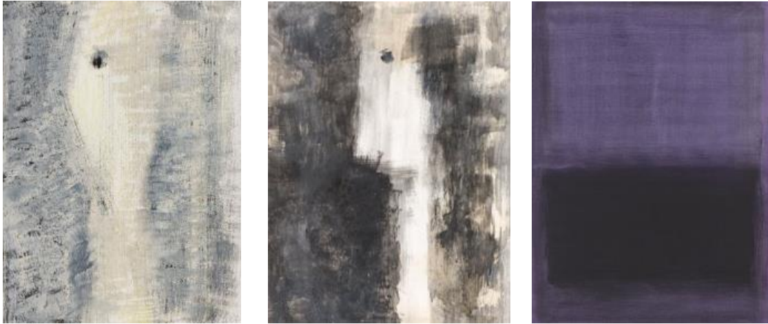
Carbon, o.i inkt, Venetiaanse Aarde, chamotte klei, Champagnekrijt

Aanleiding tot deze schilderijen is de onmacht die ik voel als ooggetuige van alle leed en onrecht in de wereld, wat ontmoet ik daar?