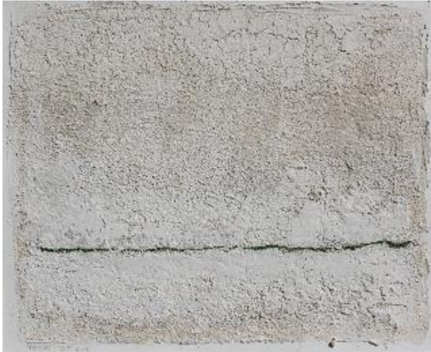
Aarde - Puimsteenkorrels - Champagnekrijt