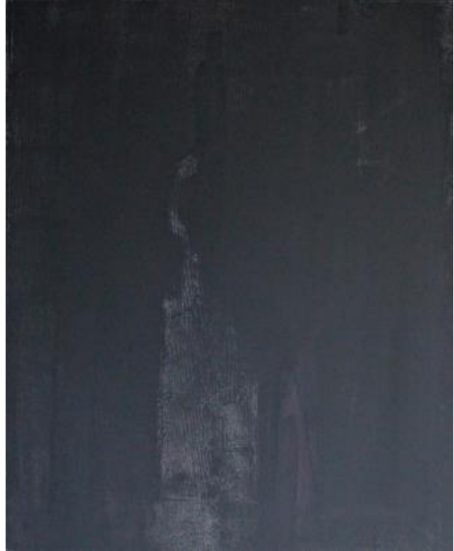
Luisteren - carbon, kalkviolet pastelkrijt: