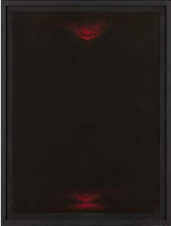
Zwart en rood - het duister begint te klinken diverse zwarten