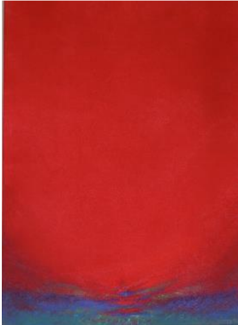
Opstanding - Pastelkrijt - roden, blauw en groen

Ik merk dat ik op weg moet gaan, dat duister in, en dat warmte en licht je daar tegemoet kunnen komen, als genade. Een weg van 'Stirb und Werde', verbonden met het Mysterie van Golgotha.